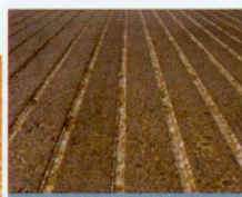
ST-Grooving (특허 제 10-0989641호)

Thinking & Change, 생각하고 변화하라! 인간중심 최적의 교통문화를 만들어 가기 위한 당사의 기본철학입니다.