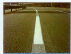
SSEL (특허 제 10-0832110호)