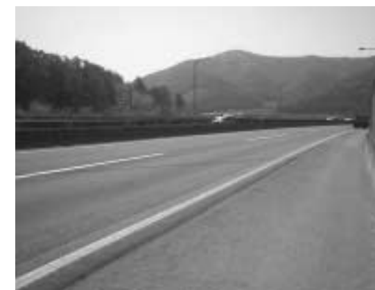
[그림 1] 그루빙 시공 사례