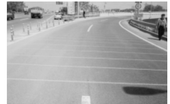
[그림 1] 그루빙 시공 사례