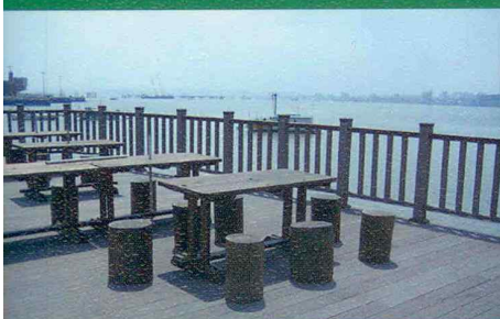
친환경합성목재 합성목재 디자인렌스 파고라 체육시설