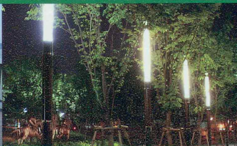
경관조명 가로등주 공원등주 블라드 복합형 공원등주