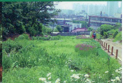
식생완성형 초화류 자연형 생태하천 복원 사면녹화 관수시설 화단조성 옥상녹화 입면녹화 인공수로녹화